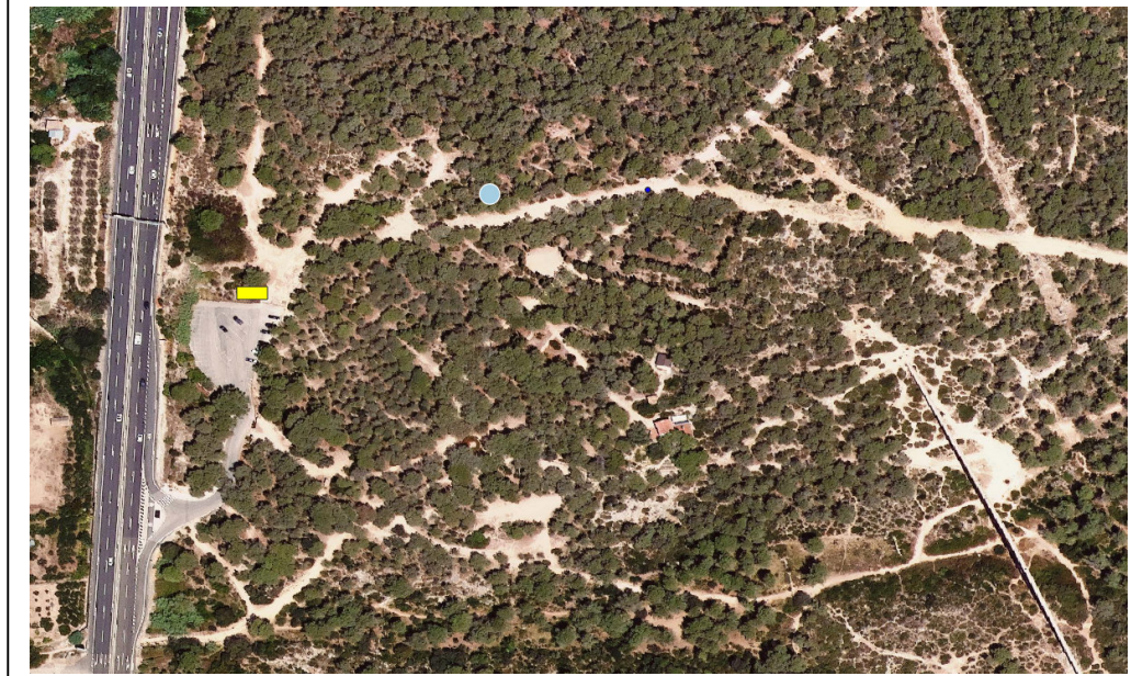
Imatge 3: emplaçament cartell de la demarcació de Tarragona. Punt d'aigua del Mas dels Arcs

En aquesta demarcació, s'ha optat per posar el cartell al municipi de Tarragona, concretament en el punt d'aigua construït a costat del Pont del Diable, edificació de l'època romana. Aquesta ubicació bé donada per l'elevada freqüència de visitants que te la zona. Els terrenys son de propietat municipal