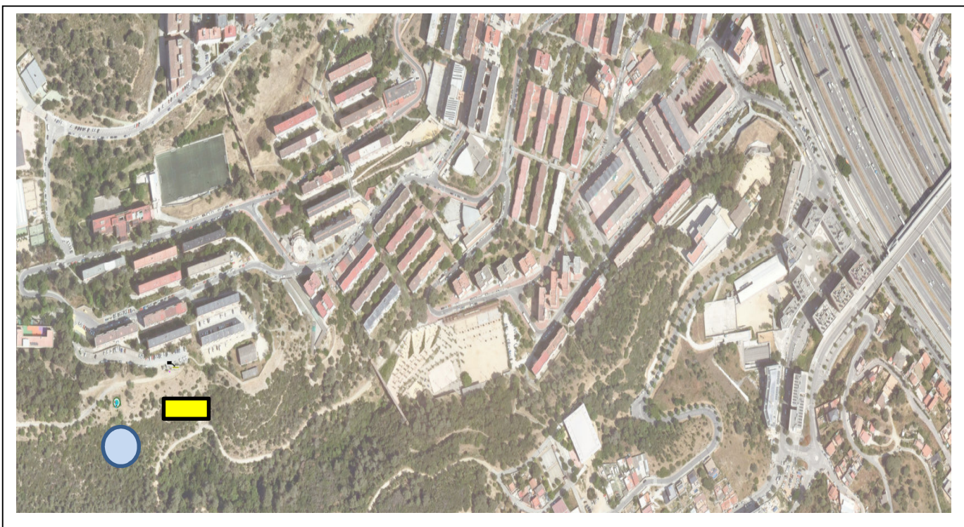
Imatge 2: emplaçament cartell de la demarcació de Barcelona. Punt d'aigua del Ciutat Meridiana.

En aquesta demarcació, s'ha optat per posar el cartell a Ciutat Meridiana, (Barcelona), concretament a la zona d'aparcament en l'àmbit del parc de Collserola. És un punt molt visitat i proper, amb un excel·lent accés.