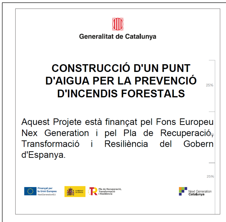
Imatge 9: Cartell permanent

El cartell serà fabricat amb compòsit de grandària de 250*250 mm. El model i la simbologia es mostren a la imatge