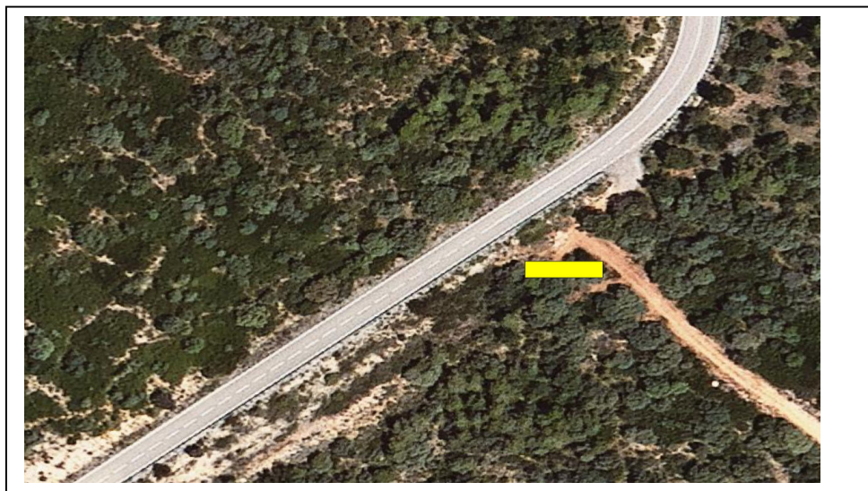
Imatge 1: emplaçament cartell de la demarcació de Lleida. Pista de Setcomelles