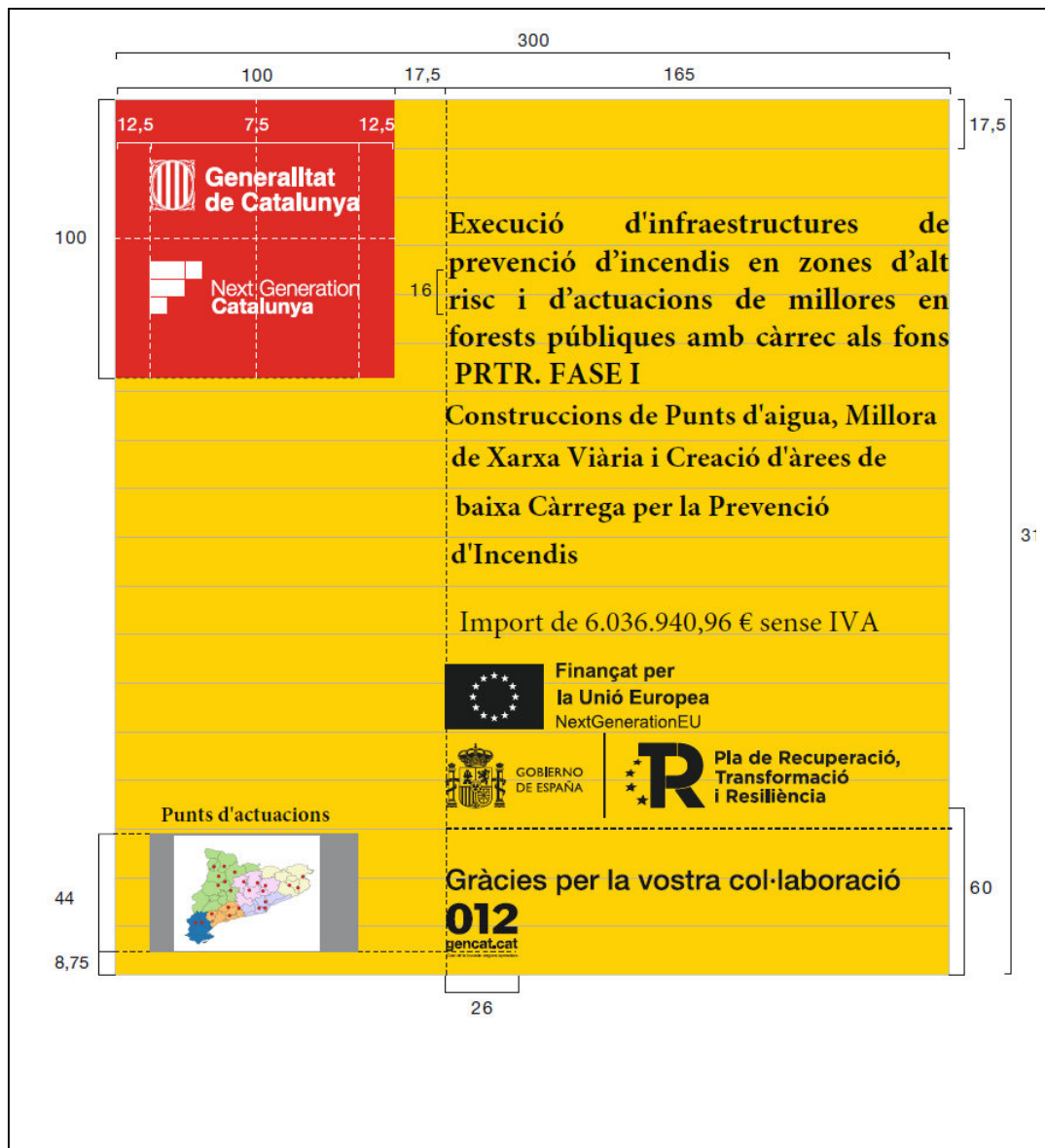
Imatge 6: Cartell Fase I. SSTT de Lleida