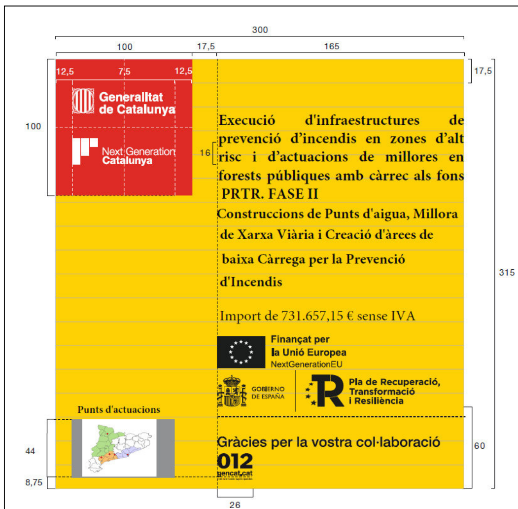
Imatge 7: Cartell Fase II. SSTT de Barcelona