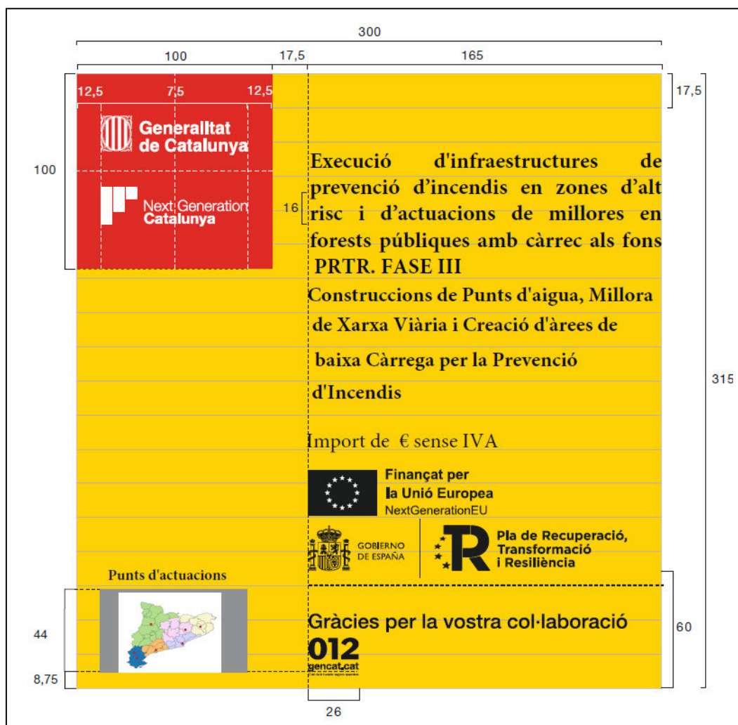
Imatge 8: Cartell Fase III. SSTT de Tarragonaa